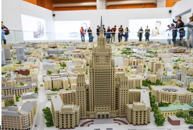
Рисунок 1. Макет