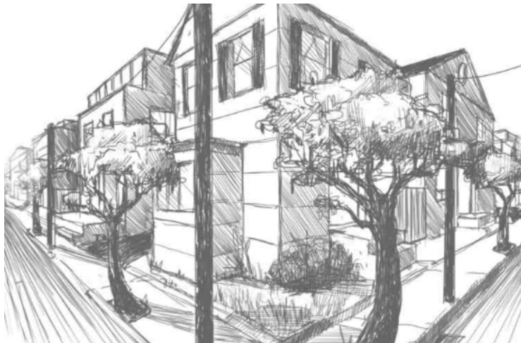
Рисунок 3. Скetch.